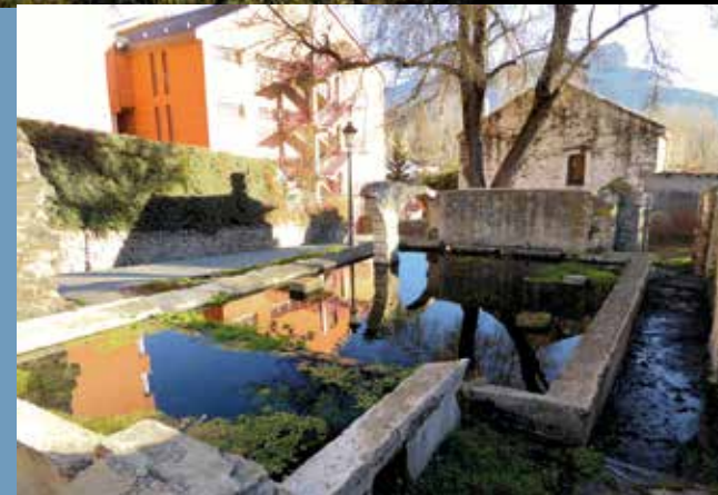
Antiguos lavaderos de Jaca.

el puente de la Lana. Allí lo abandonamos para girar a la izquierda hasta la rotonda de Barós, donde volvemos a unirnos de nuevo al otro sendero. Calle Tierra de Biescas, que cruzamos para meternos en el camino de la Corona de los Cuervos, topándonos con la vía del tren, que sorteamos por un paso subterráneo, tomando el camino de la izquierda para llegar a la fuente de Merchán. Salimos a la variante y nos dirigimos por la izquierda hasta otra rotonda, la de