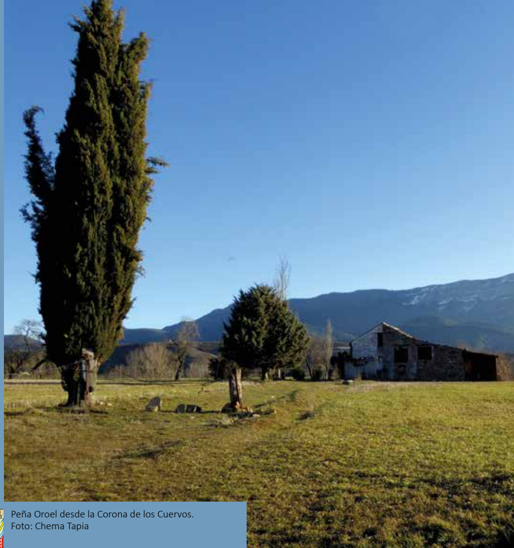
Peña Oroel desde la Corona de los Cuervos.

Esta ruta circular desde Jaca puede iniciarse desde uno de los miradores de la ciudad, el Banco de la Salud, en el extremo oriental del paseo de la Cantera, junto a la salida de la N-240. Recorre la Cantera hasta el monumento a la Jacetania, cruza la A-2605, toma un sendero a la izquierda y pasa por el mirador de la Solana o Rompeolas. La ruta continúa por el camino de Monte Pano y, dejando atrás las urbanizaciones, sigue por camino ancho de tierra sobre el trazado del Camino de Santiago. Continúa por el camino de Mocorones, cruzando la N-240 y acercándonos al cementerio, nos adentra en zona de huertas y, en un brusco giro a la izquierda, se asoma a la cuenca del Gas, en un lugar conocido como Finisterre, otro sorprendente mirador sobre los campos y huertas cercanas. Luego dejamos el Sendero de los Ríos a la derecha y seguimos por el nuestro, a la izquierda, por un camino flanqueado por valla de madera hasta la fuente de Forranchinas, cercana a un punto de