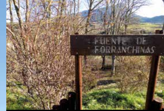
Entrada a la fuente Forranchinas.

interpretación de la Ruta Geológica Transpirenaica. Frente a la capilla de San Cristóbal, tomamos a la derecha un camino que discurre por debajo de una zona urbanizada y nos conduce a la parte trasera de la residencia Santa Orosia. Volvemos a terreno urbanizado y continuamos por la derecha hasta salir a la carretera, frente al cuartel de la Victoria y luego hasta la rotonda de la gasolinera, la superamos por el paso de peatones de nuestra derecha. Enfrente tenemos el colegio de los Escolapios, y los antiguos lavaderos, a los que llegamos haciendo la raqueta en el paso de peatones frente al colegio.